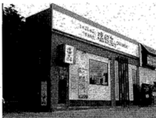
「しやぶしやぶ温野菜」(富山市の二口店)