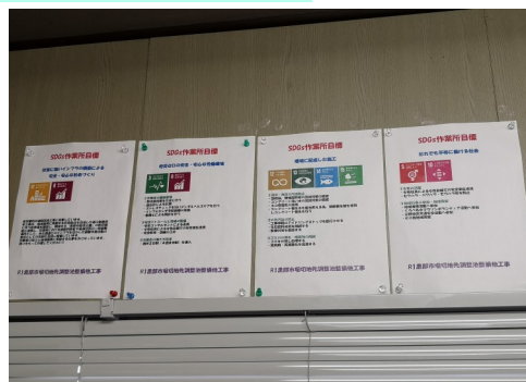
❖ 現場事務所に掲示